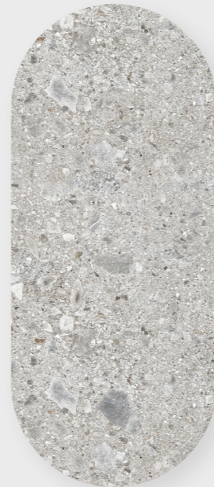
CEPPO DI GRE